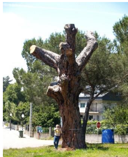
Santuario das Marabillas (Espinoso- Cartelle; Ourense). - 4,23 m de perímetro. Está seco.