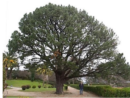
O Castro (Vigo) -17 m de altura; 4,85 m de perímetro.