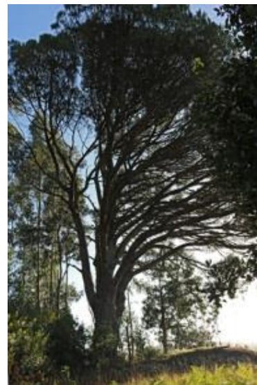
As Portelas (Paradela, Meis) -5,68 m de perímetro