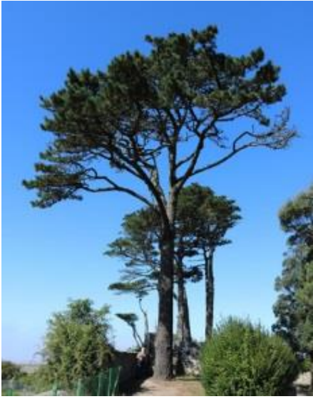
Castelo de Santa Cruz (A Guarda) -3,50 m de perímetro)