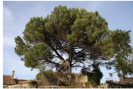
Carricovas (Silleda, Pontevedra), 4,20 m perímetro.