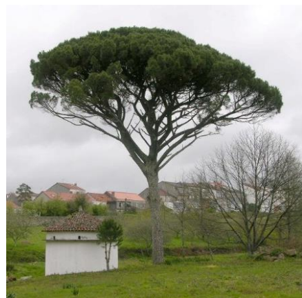
Negreira (A Coruña) Detrás do pazo, no centro da vila.