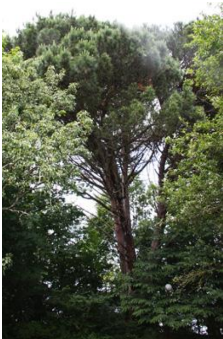
Pazo de Orto. (Abegondo, A Coruña). -25 m de altura e 5,40 m de perímetro.