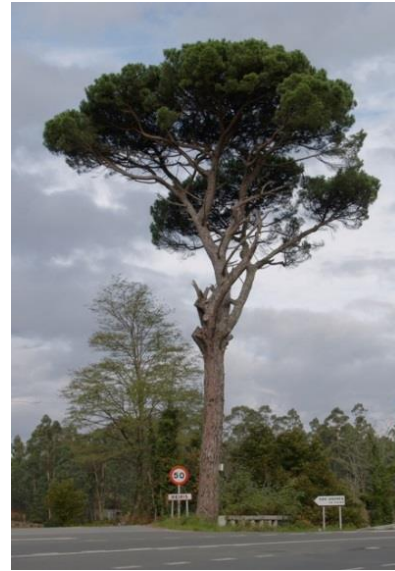
Reiris (Caldas de Reis, Pontevedra) Na estrada a Cuntis.