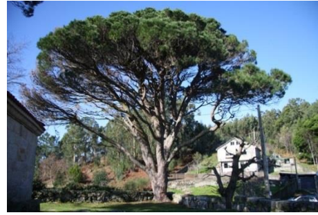
Capela San Roque do Monte. (Cangas, Pontevedra) Dous exemplares de -4,90 e 4,50 m perímetro.