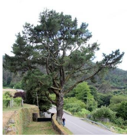
Castelo de Soutomaior (Soutomaior, Pontevedra) -3,44 m de perímetro