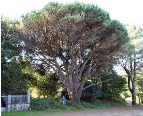
Viñas Novas (Boa, Noia, A Coruña) -5,8 m de perímetro