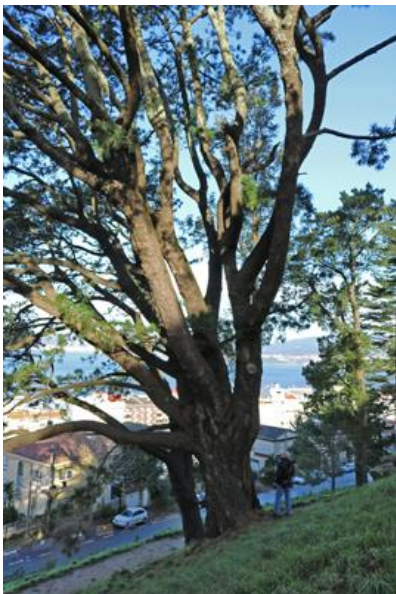
O Castro (Vigo) 4,50 m de perímetro.