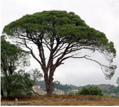
Pazo de Gondar (Santa María de Xeve, Pontevedra)