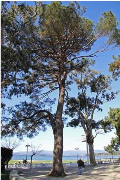
Parque de Compostela (Vilagarcía de Arousa)