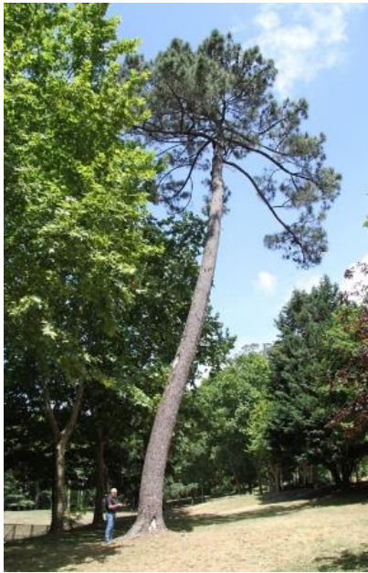
Parque de Castrelos (Vigo) -2,50 m de perímetro