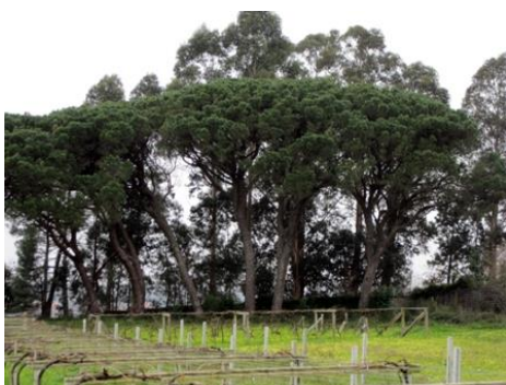
Cortiñas (A Modia, Vilaríño, Cambados, Pontevedra) Un grupo de 15 exemplares. O máis grosso mide 2,7 m de perímetro.