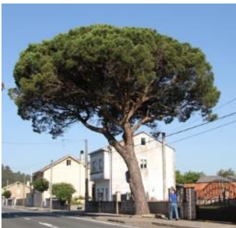
Feira de Verdillo (Carballo)