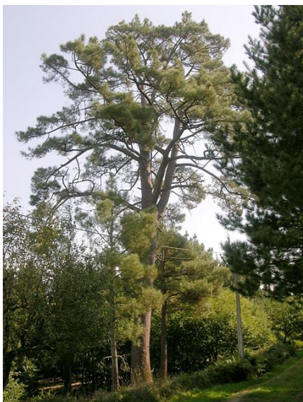
Cuíña (Ouro de Arriba; Guntín de Pallarés; Lugo) -33 m de altura e 4,50 m de perímetro