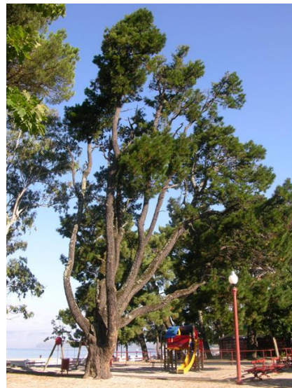
Parque de Compostela (Vilagarcía de Arousa, Pontevedra)