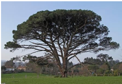
Pazo de Cabido (A Torre, Baión, Vilanón de Arousa, Pontevedra) -6,25 m de perímetro. (P)