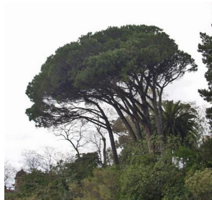
Castelo de Santa Cruz- (Oleiros, A Coruña)