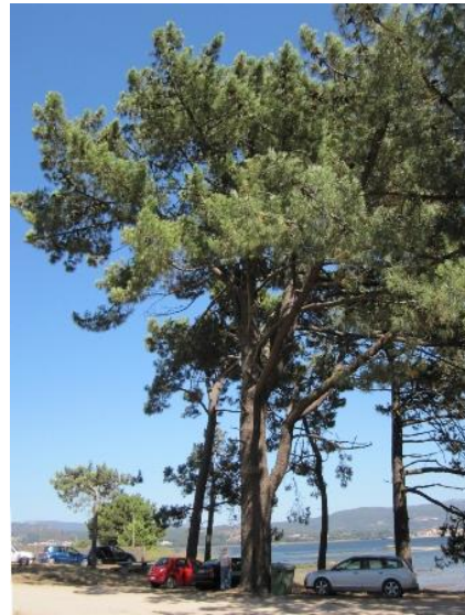
O Codesal (Camposancos, A Guarda, Pontevedra) -3,98 m de perímetro