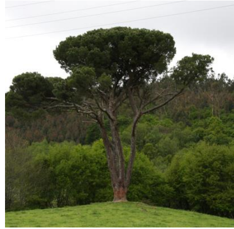
Ribadiso (Boimorto, A Coruña).