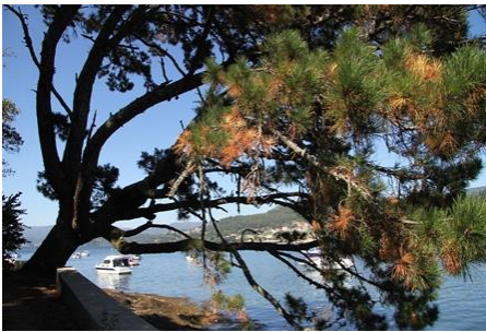
Illa de San Simón (Redondela) -3,10 m de perímetro.