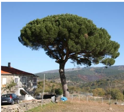
Lumeares (A Teixeira; Ourense). -3,90 m de perímetro. Atópase a pé dunhas casas na estrada que vai ao canón do Sil desde Lumeares.