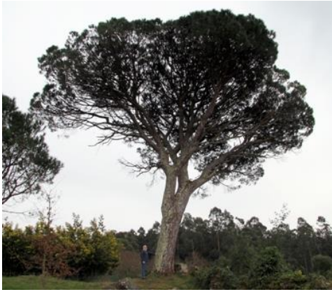
Mexachán (Arcade, Soutomaior, Pontevedra)