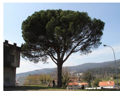
O Casal (Poio, Pontevedra) -3 m de perímetro.