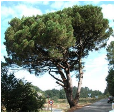
Ponteliñares (A Estrada, Pontevedra).