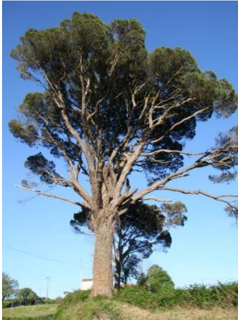
Boente (Arzúa, A Coruña). Atópase á beira da estrada de Arzúa a Melide.