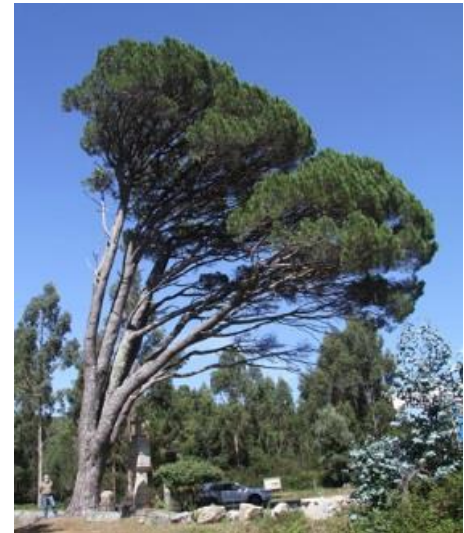
Cruceiro de Moldes (A Pobra do Caramiñal) No cruce da estrada que sube ao Barbanza. -3,34 m de perímetro.