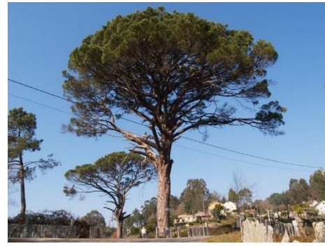
Candeiras (Celeiros, Pontearreas, Pontevedra) Na finca O Castro. -30,8 m de altura e 4,95 m de perímetro. Desaparecido