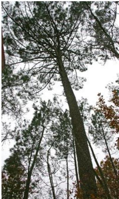
Freás (Cea, Ourense)