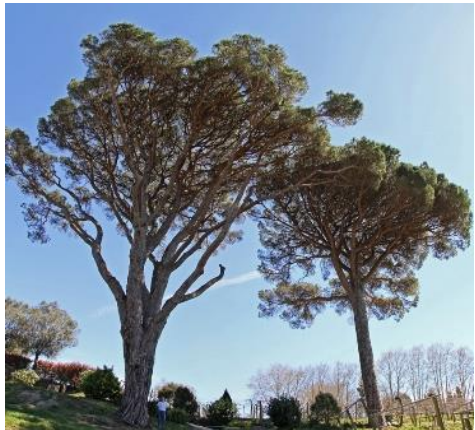
Quinta do Couselo (O Rosal, Pontevedra) -28 m de altura; 4,38 m de perímetro. -26 m de altura; 3,68 m de perímetro. (P)